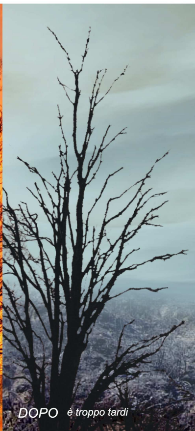
DOPO è troppo tardi

QUATTRO REGOLE PER SEGNALARE UN INCENDIO per permettere un più rapido ed efficace intervento delle squadre di spegnimento: